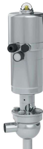
Fig. 2: Positionneur type 3724 combiné avec un SM pneumatique type 3379 et vanne équerre type 3347