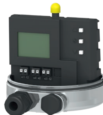
Fig. 1: Positionneur type 3724 (capot enlevé)